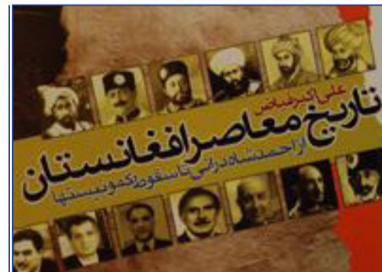
تواریخ معاصر شکل گیری حکومت در حکومت های معاصر افغانستان