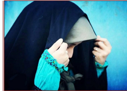
سیمای درخشان زن در فرهنگ اسلام