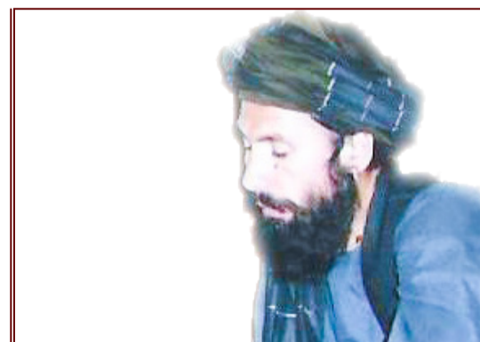
زیدگی نادمه ژناده شعیب حاما طری پاور