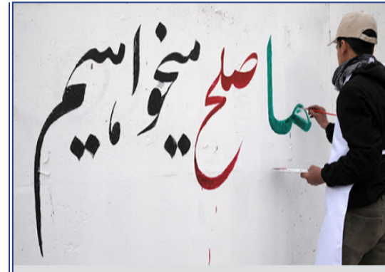
پروسه صلح را پایه جدی گرفت!